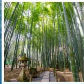
วัดโฮโคะคุจิ