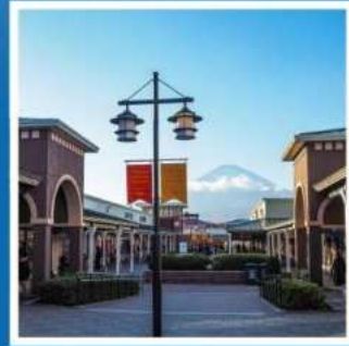
ช้อปปิ้งโกเทมมะ

สักการะพระใหญ่โตบุทสึ ที่วัดโคโตคุอินก่อนขึ้นปี ช้อปปิ้งโกเทมมะ พรีเมียม เอ้าท์เล็ตส์ อย่างจุใจ เต็มเวลา หมู่บ้านโอชิโนะฮะโก หมู่บ้านน้ำใสศักดิ์สิทธิ์ ประสบการณ์แสนสนุก ล่องคาบะบัส ชมฟูจิ สัมผัสวัฒนธรรมเช้าของเหล่าคนญี่ปุ่น ณ ตลาดปลาซึกิจิ เก็บภาพความประทับใจ ณ วัดโฮโคะคุจิ ป่าไฟแห่งคามาคูระ พักออนเซ็น 1 คืน // อาหาร : บุฟเฟ่ต์ชาบูไม่อื่น บุฟเฟ่ต์ชาบู อิสระฟรีเดย์ 1 วัน โรงแรมใกล้รถไฟฟ้า 3 สาย ที่โตเกียว 2 คืน