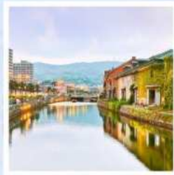
เมืองโอตารุ