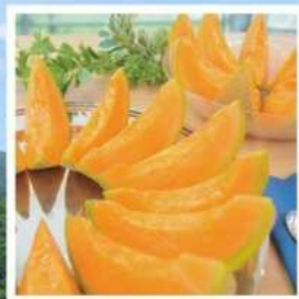
ศูนย์จำหน่ายเมล่อนยูบาริ