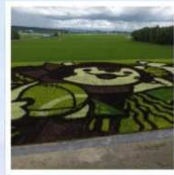
ศิลปะบนนาข้าว