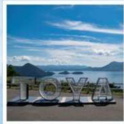
จุดชมวิวจิโงโตะ

ชมวิวที่สวยงามที่สุดบนทะเลสาบโทโยะ ณ จุดชมวิวจิโงโตะ เมืองสุดแสนโรแมนติก กับถนนสายของหวานชื่อดัง โอตารุ ศิลปะบนนาข้าว เรื่องราวในทุ่งนาสะท้อนจิตวิญญาณแห่งฮอกไกโด ที่ 1 ปี มีครั้งเดียว กิน กิน และ กิน จูใจไปกับเมล่อนเย็นฉ่ำแบบไม่จืด ชมฟาร์มโคนมชื่อดัง นิเซโกะ ทาคาฮาชิ กับวิวโยเทแสนพิเศษ สวนดอกไม้กับวิวเทือกเขาที่โด่งดังที่สุดแห่งฮอกไกโด ณ สวนชิชิโซโนะโอกะ พักออนเซ็น 1 คืน!!! พักในเมืองชิโงโตะ 2 คืน เมนูพิเศษ...บุฟเฟ่ต์เมล่อน, บุฟเฟ่ต์ซาปู, บุฟเฟ่ต์ซาบู, บุฟเฟ่ต์บิงย่าง กรุ๊ปสบายๆ เพียง 20 ท่านเท่านั้น!!!