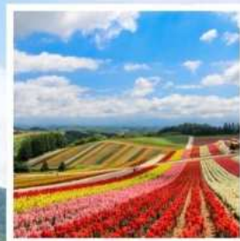
สวนดอกไม้ชิชิโซโนะโอกะ