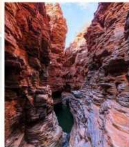
แกรนด์แคนยอนยูอาโกว