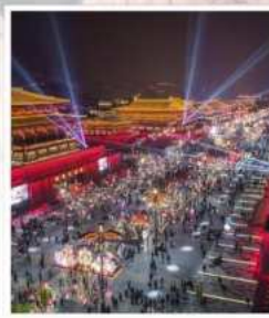
ถนนคนเดิน วัฒนธรรมต้าถัง