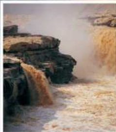
น้ำตกหูໄຂ່