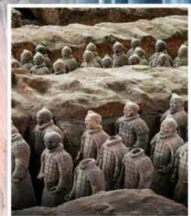
พิพิธภัณฑ์กองทัพใต้ดินทหารม้าจีนซี