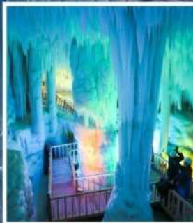
ถ้ำน้ำแข็งอวิ้นชีวซาน