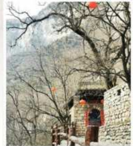
หมู่บ้านถ้ำเอ๋อเป้อ